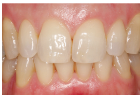
Gezond roze tandvlees

Gezond tandvlees is roze, niet pijnlijk en bloedt niet wanneer u rondom uw tanden poetst of de interdentale ruimtes reinigt.